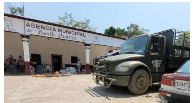
Se instalaron campamentos en las comunidades de Santa María Magdalena y Benito Juárez, donde se concentraron herramientas y víveres.

atulco y del Estado de Oaxaca, Ejército Mexicano, así como seis brigadas de la Comisión Nacional Forestal (Conafor) provenientes de diferentes regiones del estado, dos brigadas de la Comisión Estatal Forestal (Coesfo), brigada del Parque Nacional Huatulco, así como habitantes de Santa María Magdalena, Pluma Hidalgo, Benito Juárez, Rio Sal y San Pedro Cafetiltán.