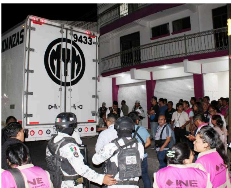
Las boletas llegaron a Huajuapán la noche del 7 de mayo.

Es preciso mencionar que el Instituto Estatal Electoral y de Participación Ciudadana de Oaxaca (IEEPCO) entregará boletas a los Consejos Distritales para la elección a Diputados Locales y Presidentes Municipales.