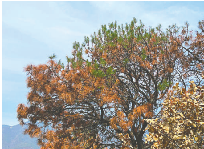
Algunos árboles están reverdeciendo.