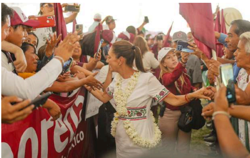
La morenista recibió el apoyo de Zongolica, Veracruz.

Al respecto, puntualizó que, como parte de los compromisos que hace la 4T para la siguiente etapa de la Transformación, desta-