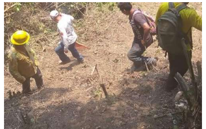
Las labores de vigilancia continuarán durante las siguientes 48 horas con el fin de detectar reavivamientos.

Adicionalmente, se instalaron campamentos en las comunidades de Santa María Magdalena y Benito Juárez, donde se concentraron herramientas y víveres que fueron aportados por autoridades