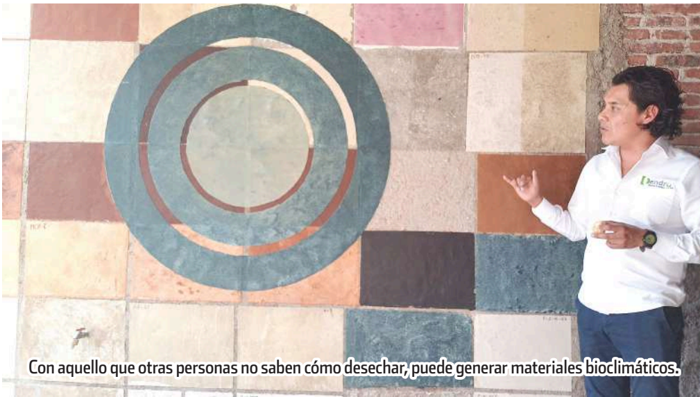
Con aquello que otras personas no saben cómo desechar, puede generar materiales bioclimáticos.

Al no requerir cocción en un horno tradicional, no se emiten contaminantes como el monóxido de carbono o el dióxido de nitrógeno