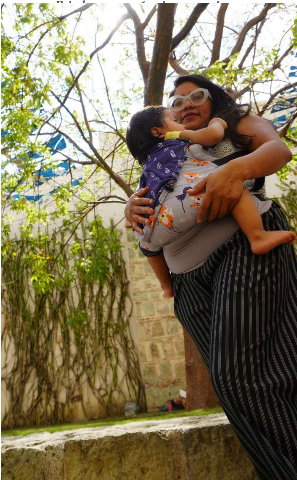
La crianza colectiva no es un concepto nuevo es una práctica que se ha perdido en las zonas urbanas.

maternidad, entre sentimientos diversos que iban desde la culpa, la tristeza y el agobio.