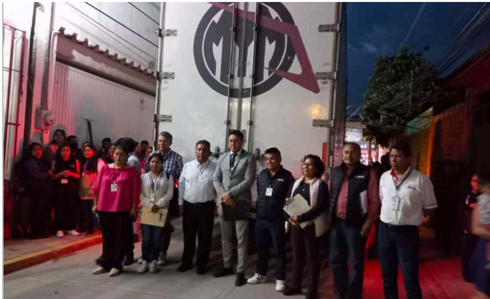
Los consejeros dieron fe de la llegada de la paquetería electoral para el 2 de junio.