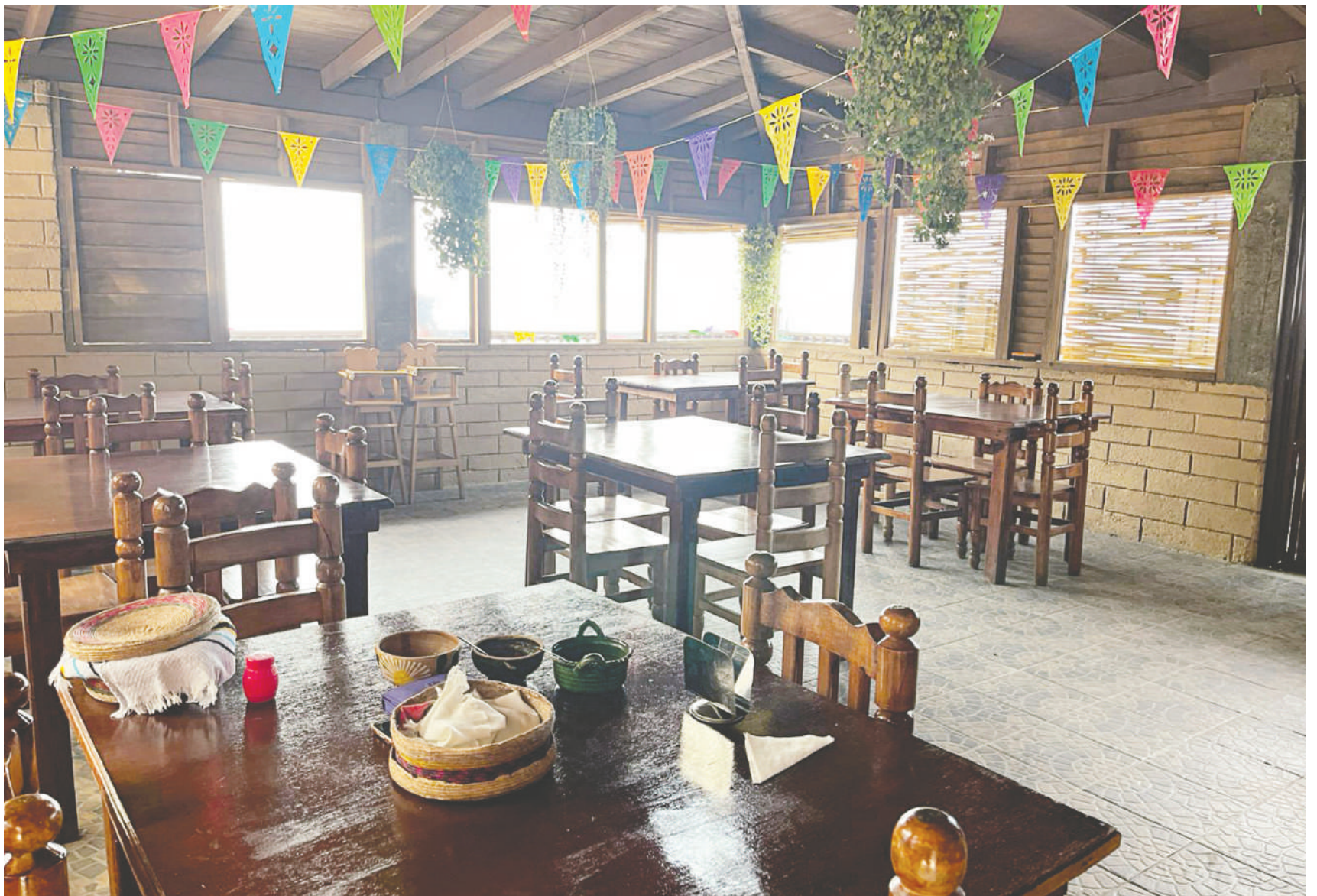
Los domingos recibían muchos clientes, pero ahora son menos.

“En Semana Santa no hubo mucha gente y ahorita, pues hay poco, pero estamos esperando, ojalá y que se vuelva a componer. Otros años, en estas fechas hay muchas personas”, expone.