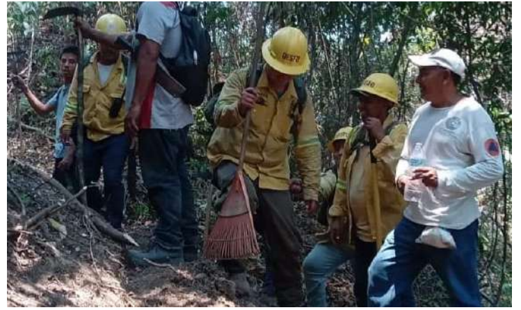
Los trabajos de combate del incendio y su consecuente sofocación estuvieron a cargo de 496 elementos de diversas corporaciones.