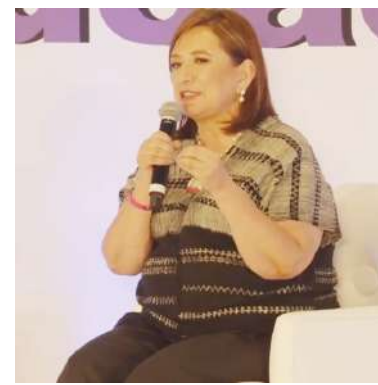
La abanderada de la coalición Fuerza y Corazón por México recordó que desde hace meses había advertido que el sistema eléctrico estaba llegando a su máxima capacidad.

Resaltó que por ello la propuesta que ha dado la otra candidata presidencial, de establecer 100