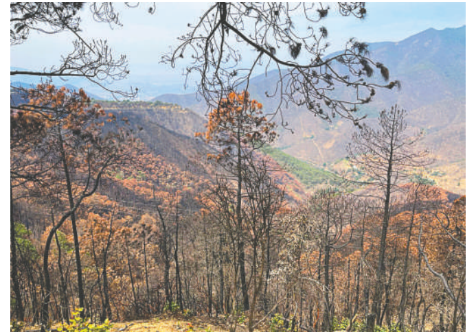
El 11 de febrero se registró el incendio.