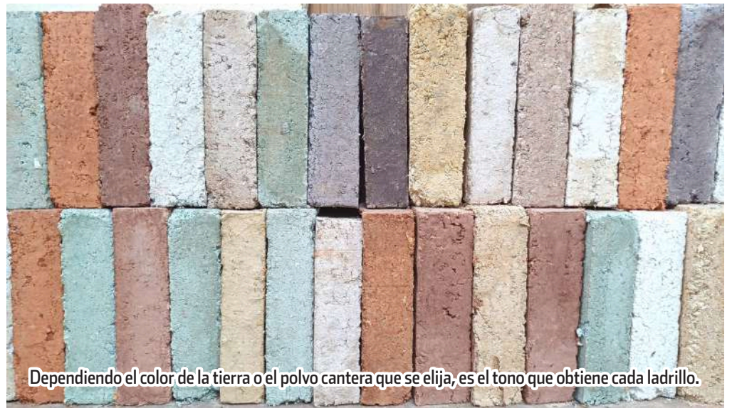
Dependiendo el color de la tierra o el polvo cantera que se elija, es el tono que obtiene cada ladrillo.

Texto y fotos: Nadia Altamirano Díaz En medio de la crisis climática que lleva a la población a enfrentar elevadas temperaturas, la elaboración de ladrillos con materiales de desecho son una alternativa de construcción bioclimática.