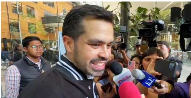
En su cuenta de la red social X, Máynez envió un mensaje a la panista.

"Ayer los jóvenes le dieron un mensaje clarísimo (con un