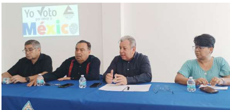
La Canaco invita a ejercer un voto responsable el 2 de junio.

Dijeron que a este programa se han sumado la iniciativa privada y la sociedad civil, por lo que el llamado es para poder salir a votar de manera responsable; además, refirieron que está en juego quien será el próximo pre-