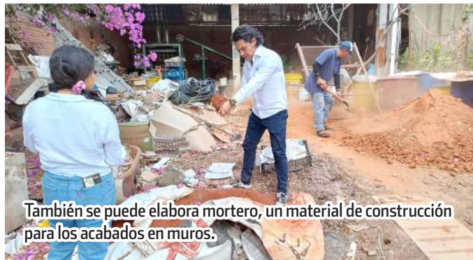
También se puede elaborar mortero, un material de construcción para los acabados en muros.