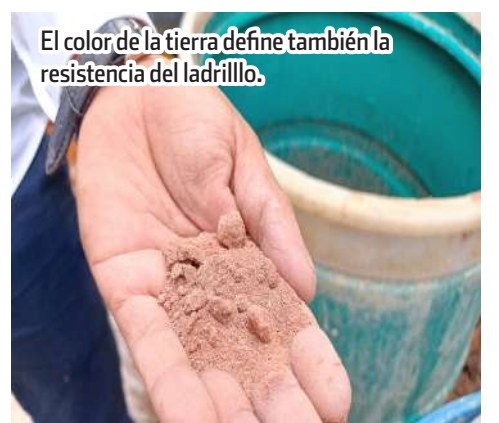
El color de la tierra define también la resistencia del ladrillo.

“Ante el desabasto de agua darle un uso a la vinaza es una alternativa, requerimos irnos a los desechos de destilados para transformarlos en biomateriales”, expresa convencido de que el calentamiento del planeta requiere frenar el consumo de productos de un sólo uso o con un alto costo ambiental.