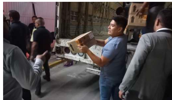
El material electoral fue llevado a la bóveda que está bajo resguardo de la Guardia Nacional.