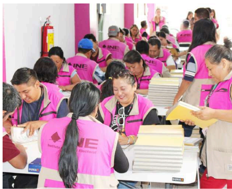
El Consejo Distrital inició con el sellado y conteo de las boletas.

Dijo que es importante que la ciudadanía tenga este sentido de participación y de esta manera poder ir a votar el día de la jornada electoral, por lo que señaló que aún se está en el periodo de las campañas electorales, por lo que la ciudadanía debe de analizar a