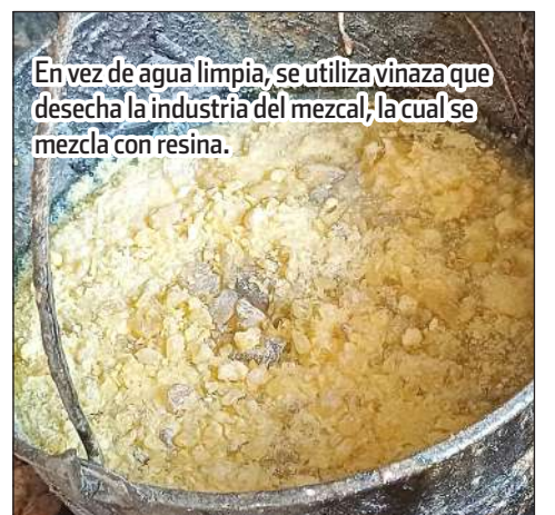
En vez de agua limpia, se utiliza vinaza que desecha la industria del mezcal, la cual se mezcla con resina.

“Nosotros no usamos agua limpia, sino vinaza”, que es un residuo líquido natural con alta carga orgánica y elementos disueltos.