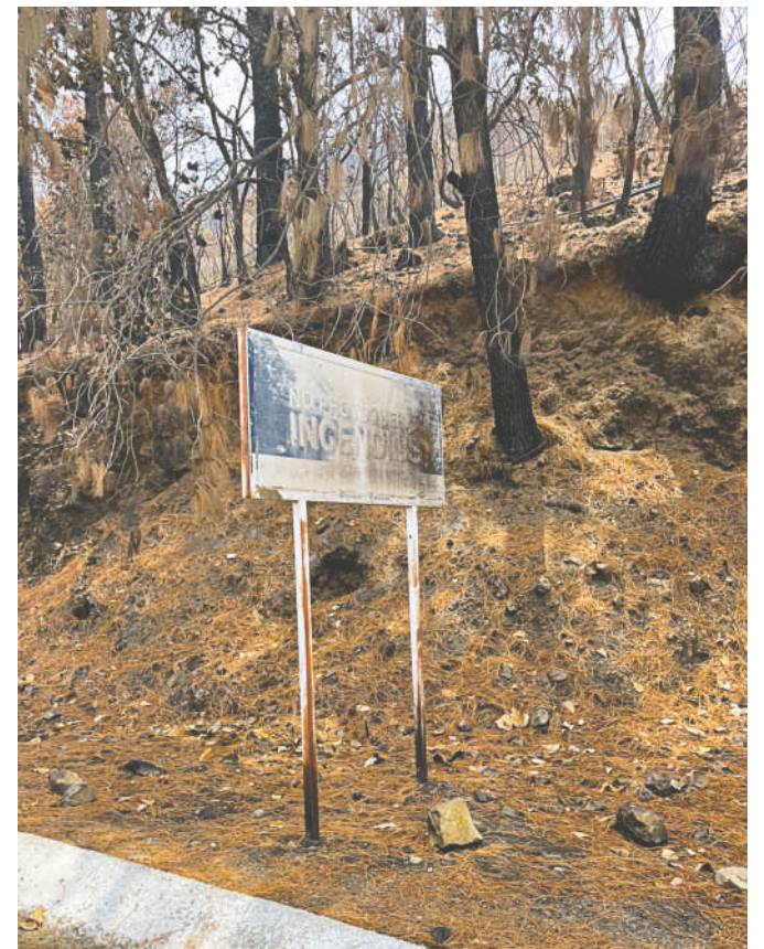
Piensan reforestar toda la zona incendiada.

Espera que cada vez más personas se acerquen a consumir sus productos y así puedan tener mayores ingresos y pagar sus deudas y tener dinero todos los días.