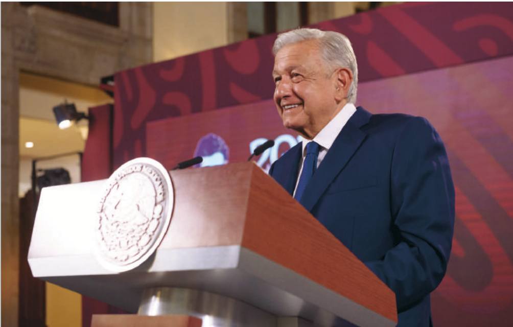
López Obrador manifestó que en los momentos más difíciles para su movimiento el periódico NOTICIAS, Voz e Imagen de Oaxaca, le abrió sus espacios.

“En todos lados nos abrían los espacios; había un control casi absoluto, eso no se me olvida, en Coahuila, ahí llegábamos y se nos llenaba de periodistas, pero todas las preguntas eran en contra y al día siguiente no salía nada o