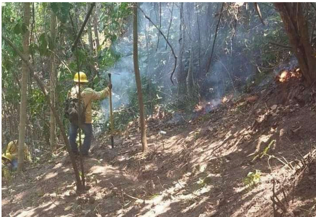
El incendio que inició el pasado 2 de mayo dejando daños en innumerables parajes aledaños, finalmente fue controlado la noche del martes 7 de mayo.

SAN PEDRO POUCHUTLA, Oaxaca.- La suma de esfuerzos de casi 500 combatientes derivó en el control total del incendio que afectó zonas de los municipios de Pluma Hidalgo, San Pedro Pochutla y Santa María Hua-