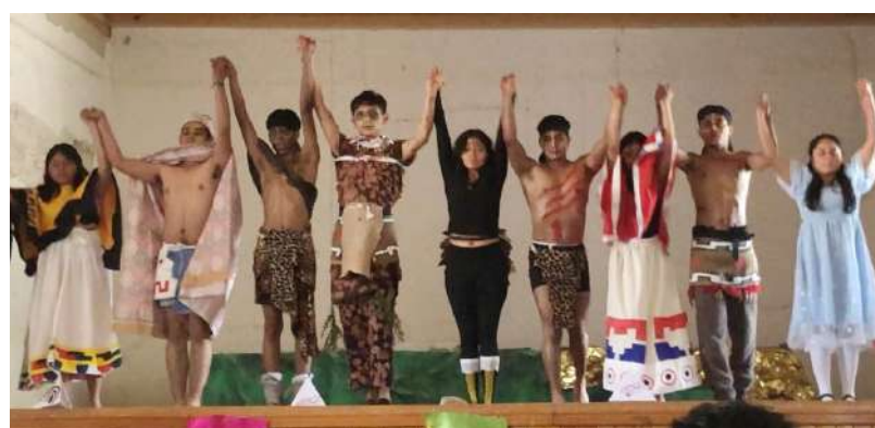
La obra de teatro fue presentada por primera vez en Tlaxiaco.

Especificó que la autoridad local ha sido una de las que más ha apostado a la difusión de la cultura, por lo que de esta manera están aprovechando los espacios en Huajuapán de León.