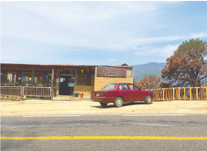
El restaurante ya abrió sus puertas nuevamente.