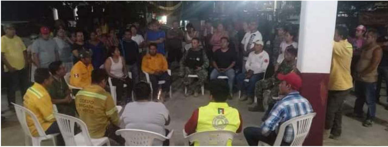
La suma de esfuerzos de casi 500 combatientes derivó en el control total del incendio.